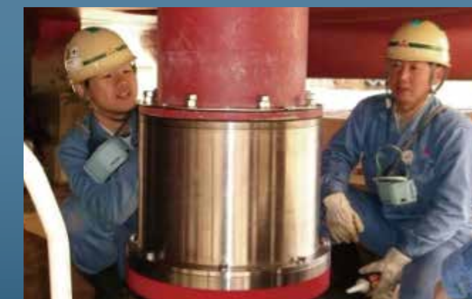
音響測位装置送受波器