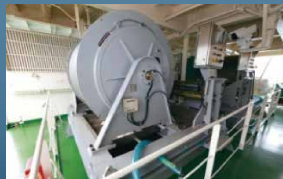
同軸ケーブルウインチ